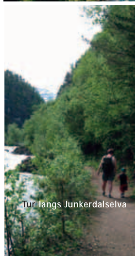
Tur langs Junkerdalselva